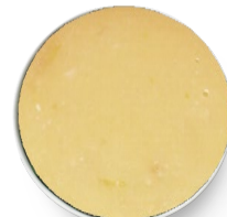
Crema de pollo baja en sodio