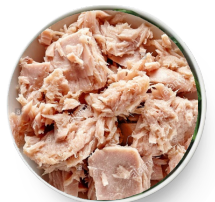
Pollo en agua, colado