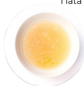
Caldo de pollo bajo en sodio