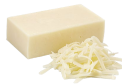
Queso cheddar rallado