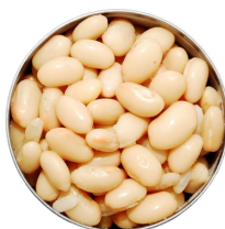
Frijoles blancos sin sal