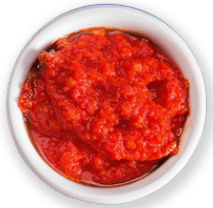
Tomate cortado sin sal