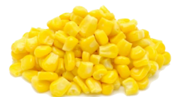
Maíz sin sal