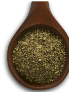
Sazonador italiano 1 cucharadita