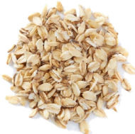
Hojuelas de avena 2 tazas