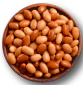
Frijoles pinto sin sal 1 lata colada - 15 oz

INGREDIENTES Porciones: 7 | Tamaño de la porción: 1 pedazo