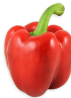
Pimentón rojo 1 mediano