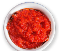
Salsa de tomate 1 lata - 15 oz