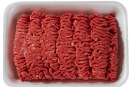
Carne o pavo molido magro 1 libra