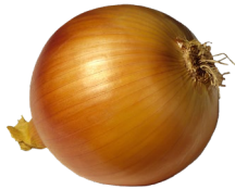
Cebolla 1/2 mediana