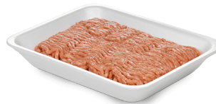
Salchicha de pavo o pavo molido 14 onzas