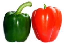
Pimentón rojo y verde 1 de cada color