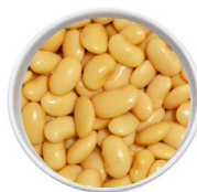
Frijoles lima enlatados bajos en sodio 1 taza