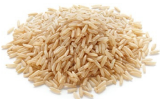
Arroz integral 1 taza

INGREDIENTES 1/2 taza de arroz con 1 taza de mezcla de pavo