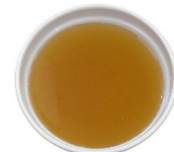
Caldo de pollo bajo en sodio 1/4 de taza