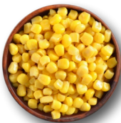
Maíz enlatado sin sal u otro vegetal 1 taza