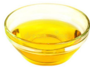
Aceite de canola 1 cucharada